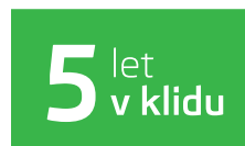
Předplacený servis na 5 let / 100 000 km při financování od ŠKODA Finance